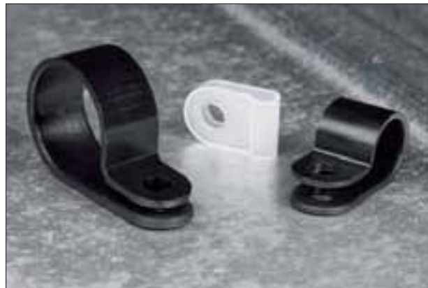
P-klips serie HP.

HP-klipsene er produsert i polyamid og har god temperaturobestandighet og høy styrke. En fordel med P-klipsene er deres mulighet til å dekke flere størrelser på kabelen.